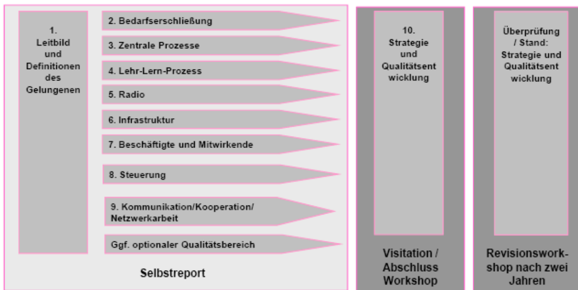
Grafik 1: Das Qualitätsentwicklungs- und -testierungsmodell

Die Ergebnisse aus den einzelnen Qualitätsbereichen werden in einem Selbstreport festgehalten. Der Selbstreport (60-90 Seiten) muss innerhalb eines Jahres abgegeben werden (bei uns ist der Termin der 22.12.2011). Nach Abgabe des Selbstreports wird dieser begutachtet und im Anschluss erfolgt eine Visitation bei Q und hoffentlich die erfolgreiche Zertifizierung. Der gesamte Prozess wird von Workshops begleitet, zusätzlich werden wir dabei von Casy Dinsing unterstützt. Ganz wichtig! Alle Mitglieder von Radio Q können und sollen mitmachen und mitgestalten. Die Einführung von QMB kostet auch Geld: Insgesamt 4.224,50 €. Davon muss Radio Q aber nur 952,00 € übernehmen, der Rest wird von der LfM gefördert. Nach dem Prozess winkt ein Zertifikat, das wir als erstes Campusradio erhalten werden! Also Radio-Q-Geschichte-schreiben ist angesagt!